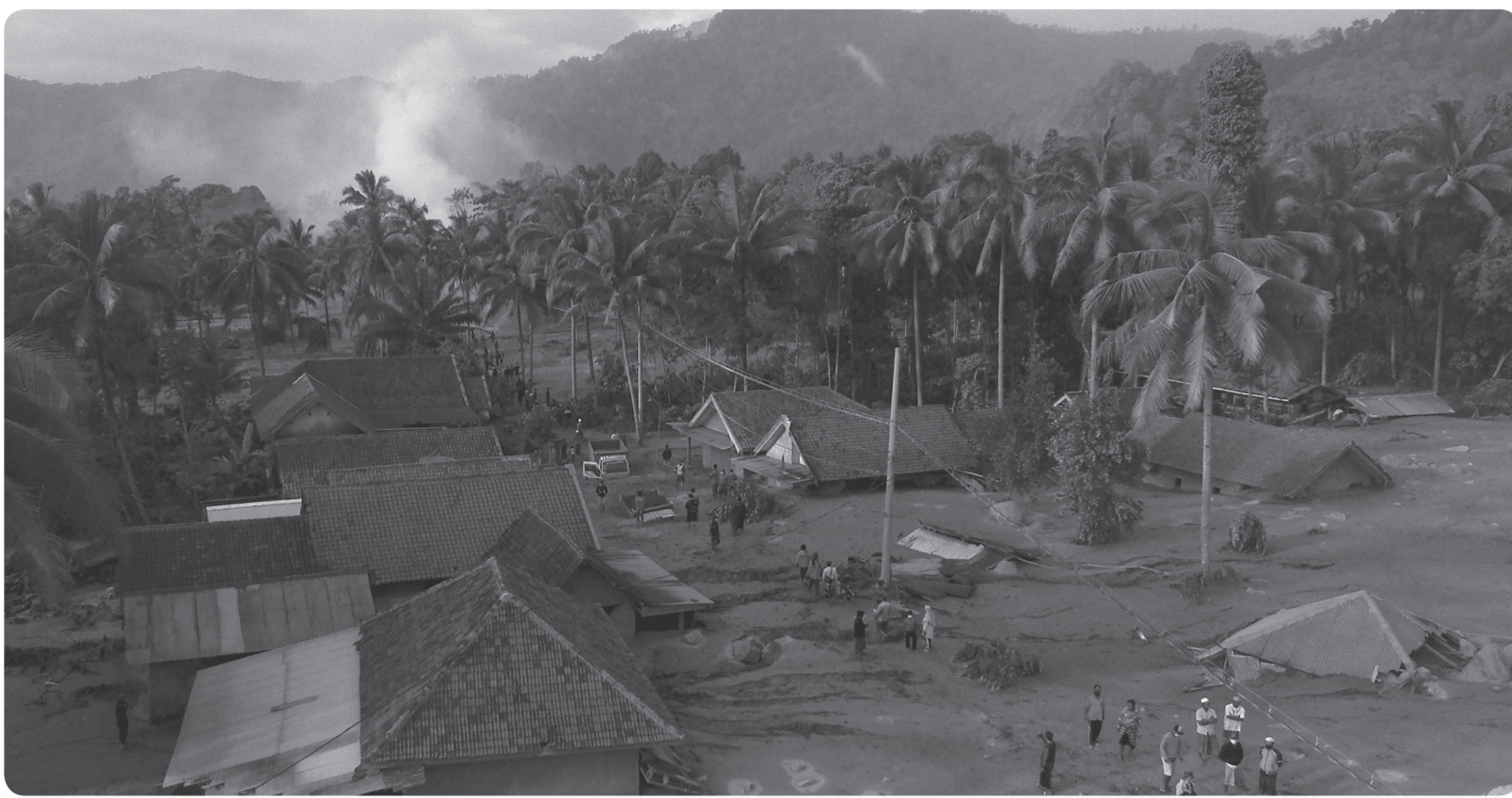
DAMPAK AWAN PANAS GUNUNG SEMERU

Foto udara kondisi permukiman warga yang tertimbun material guguran awan panas Gunung Semeru di Desa Sumber Wuluh, Lumajang, Jawa Timur, Minggu (5/12). Akibat awan panas guguran Gunung Semeru tersebut puluhan rumah warga rusak dan ratusan warga mengungsi.