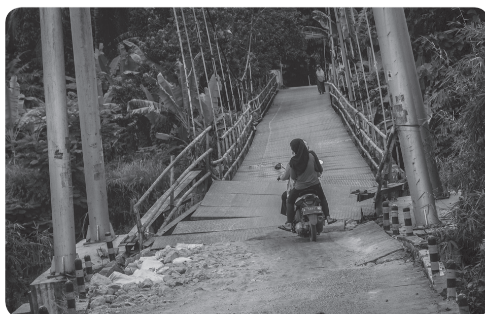
JEMBATAN GANTUNG RUSAK DI LEBAK