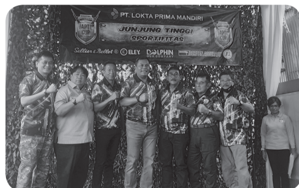
Panitia penyelenggara Japto Cup 202, foto bersama.

TANGERANG (IM) - Puluhan atlet dari berbagai klub menembak di Indonesia mengikuti ajang Shooting Competition Japto Cup 2021 di Lapangan Tembak Den Arhanud Rudal 003, Cikupa, Cikupa Kabupaten Tangerang, Sabtu (4/12).